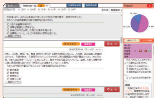
4 検索結果からテストに追加したい問題を選択していきます。