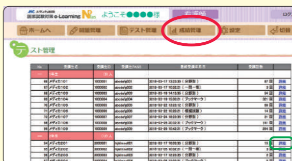
受講生一覧と受講回数

学生の正答率・得点分布・個人成績・個人進捗率・教科別正答率などいつでもチェックできる!