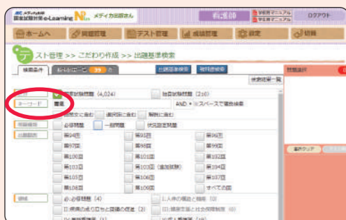
1 「胃癌」という単語が入っている問題を検索、39件ヒット。