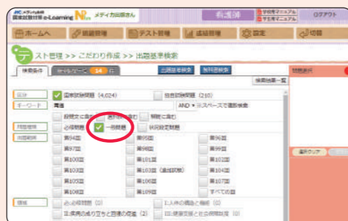
2 問題種類で「一般問題」を条件に加えると14件に絞られます。